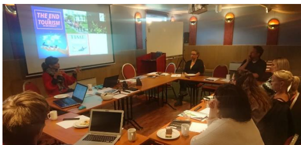
Møte på Reisafjord Hotel