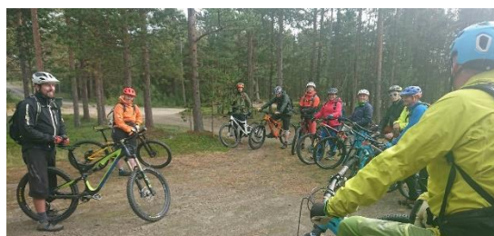
Sykelguideutdanning i Skibotn

I forbindelsen med vårt arbeid for å utvikle og kommersialisere stisykling i Lyngenfjordregionen, har vi samarbeidet med Innovasjon Norge om å gjennomføre den helt nye norske sykkelguideutdanningen i Skibotn.