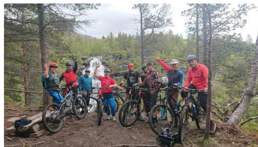
Felles sykkelturn i Skibotn

Visit Lyngenfjord gjennomførte et seks måneders prosjekt, som prosjekteier, for å utvikle bærekraftig stisykling i Lyngenfjordregionen. Målet med prosjektet var å heve den lokale kunnskapen om stisykling, kartlegge bærekraftige stier, jobbe med produktutvikling og kunnskapsheving hos bedrifter. Det ble laget en handlingsplan for videre arbeid. Prosjektet ble gjort i samarbeid med 13 lokale bedrifter og fire kommuner. Innovasjon Norge, samarbeidsbedriftene og Storfjord kommune stod for finansieringen.