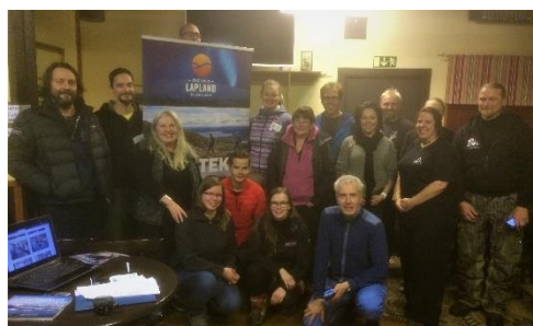
Finske og norske reiselivsbedrifter

Den 16. november inviterte bedrifter fra Kilpisjärvi og Enontekiö kommune reiselivsbedrifter fra Lyngenfjordregionen til en visningstur. Det ble gjennomført to utflukter, besøk av glassigloer og fatbike-tur, og en workshop for å bli bedre kjent med hverandre.